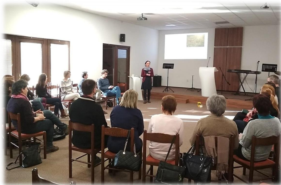
Setkání týmu Mezi stromy

Základní škola V Sadech, Římskokatolická farnost Přibyslavice, Musica animata, Knižní veletrh PhDr. Markéty Hejkalové, Krajská knihovna Vysočiny, Církev bratrská Havlíčkův Brod