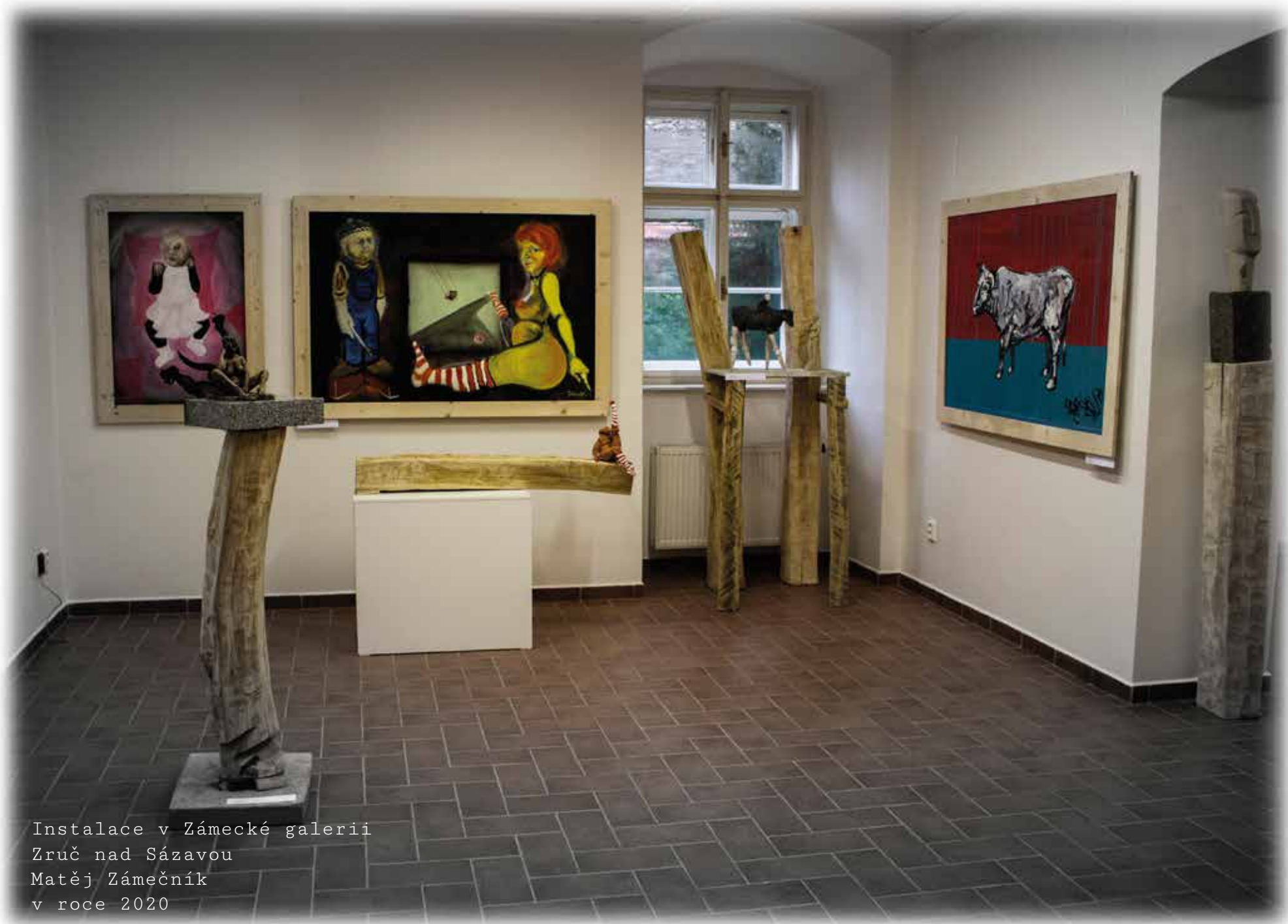
Instalace v Zámecké galerii Zruč nad Sázavou Matěj Zámečník v roce 2020