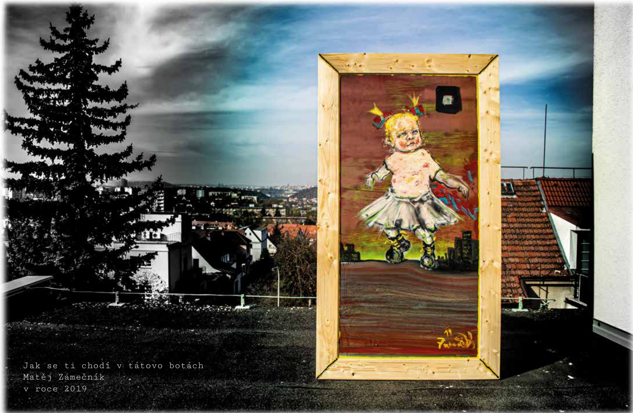
Jak se ti chodí v tátovo botách Matěj Zámečník v roce 2019