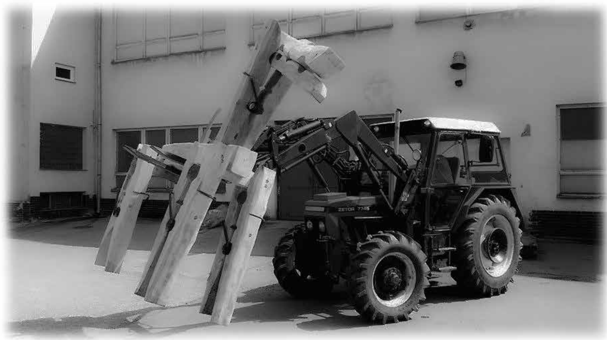
KAM VEDE TA CESTA Matěj Zámečník v roce 2015