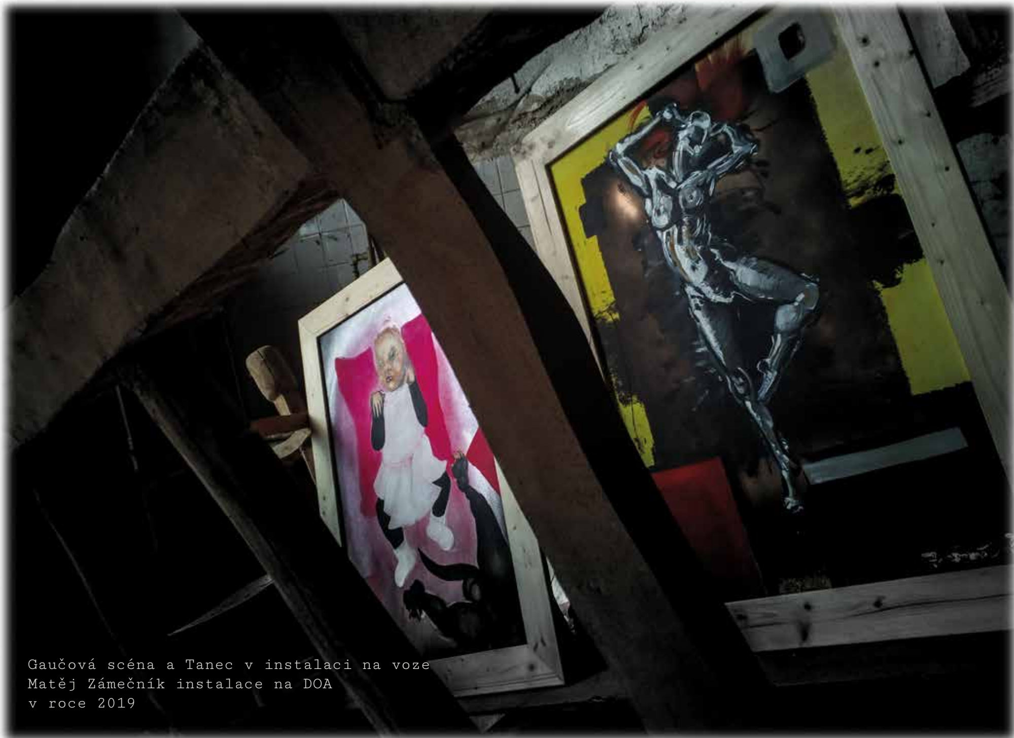
Gaučová scéna a Tanec v instalaci na voze Matěj Zámečník instalace na DOA v roce 2019