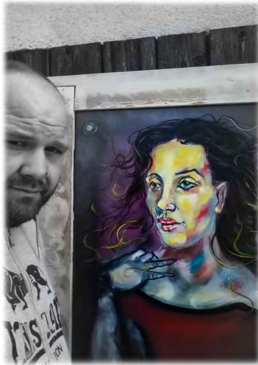
MEDUSA - olej na plátně Matěj Zámečník v roce 2019