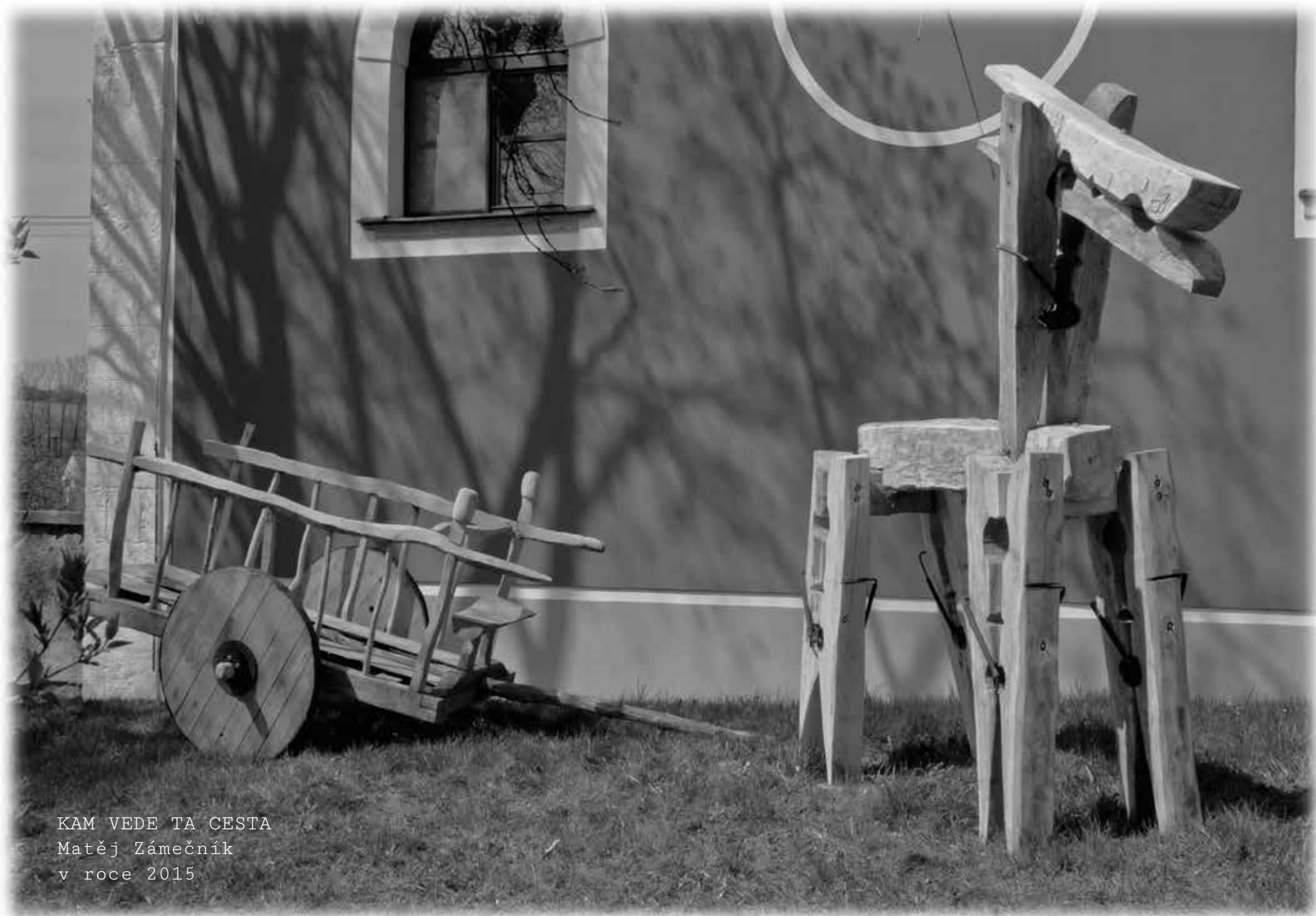
KAM VEDE TA CESTA Matěj Zámečník v roce 2015