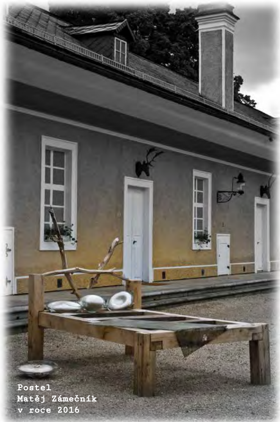
Postel Matěj Zámečník v roce 2016