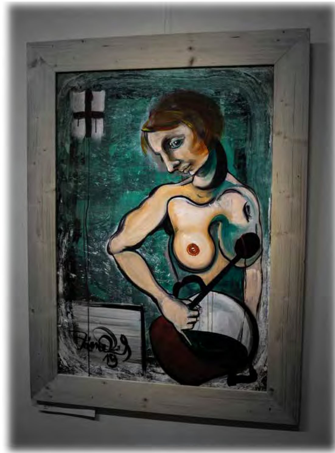
Polévka s jednou nudlí Matěj Zámečník v roce 2019