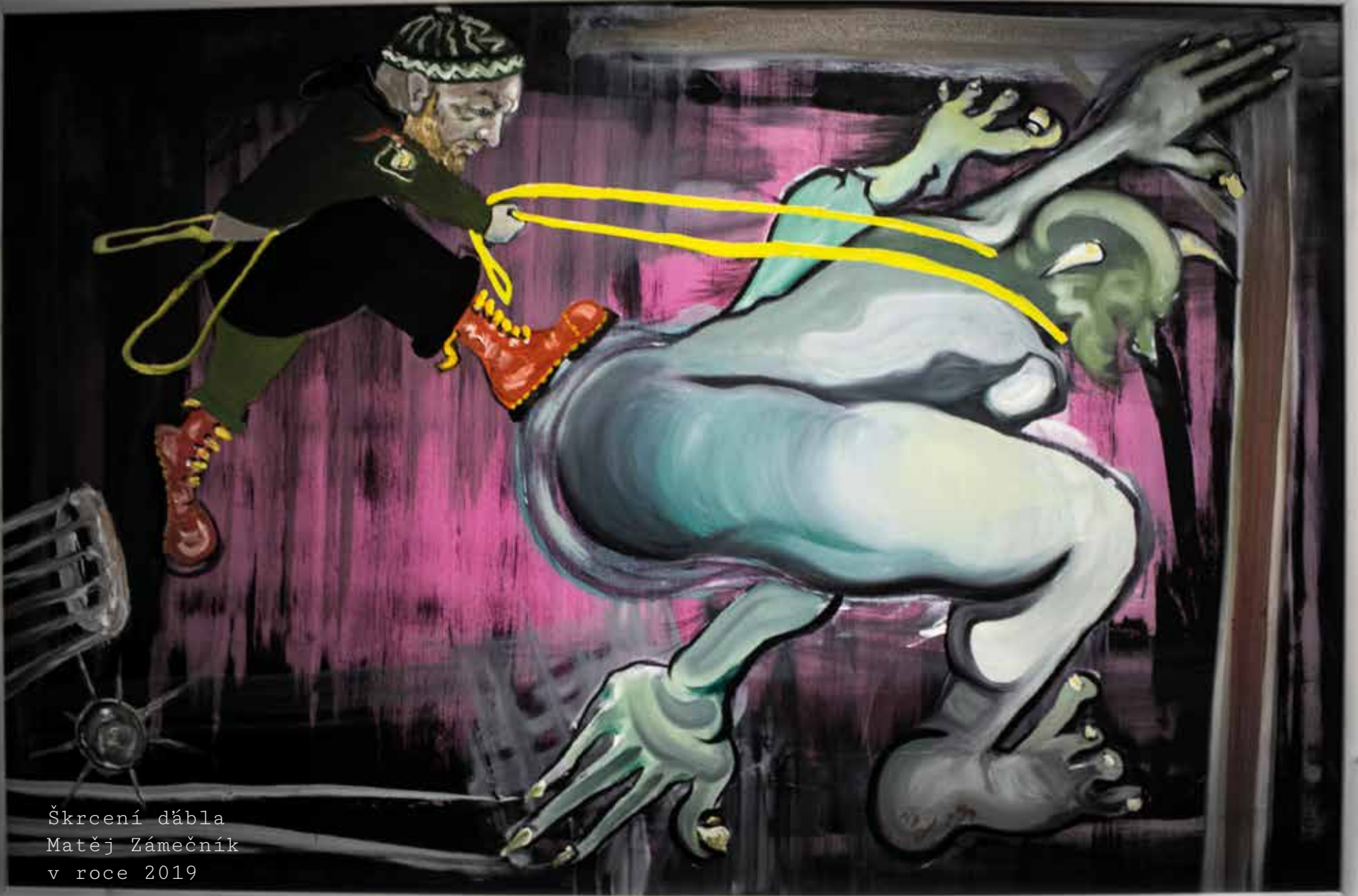
Škrčení ďábla Matěj Zámečník v roce 2019