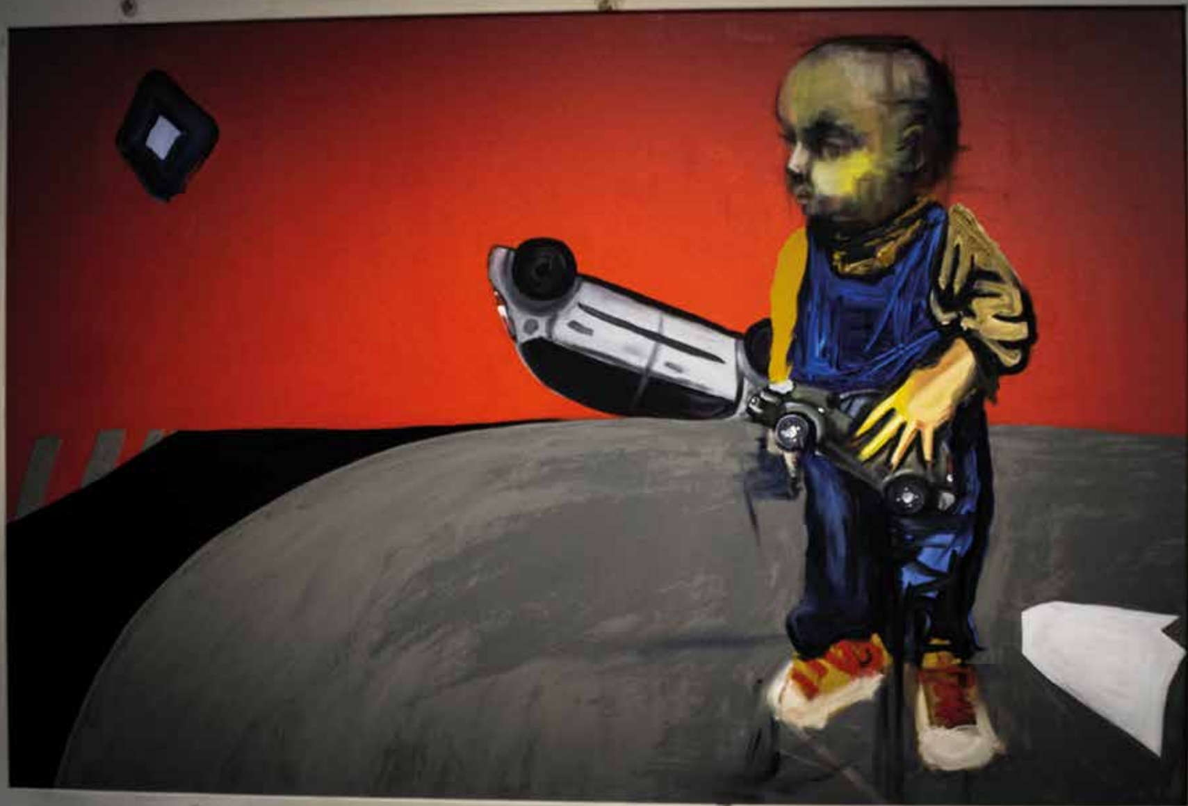
Nehoda Matěj Zámečník v roce 2017

Matěj Zámečník Nehoda 2017 100 x 100 cm olej na plátně