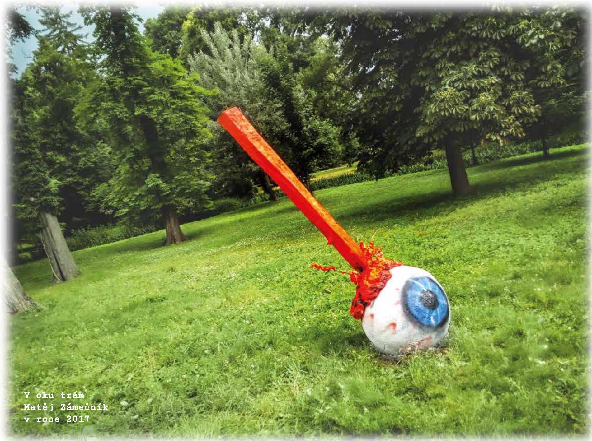
V oku trám Matěj Zámečník v roce 2017