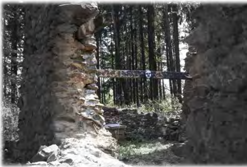
PROJEKT „CHRÁM ZŮSZANE CHRÁM“ KOSTEL ANDĚLŮ STRÁŽNÝCH V ÚSOBÍ NA VYSOČINĚ Matěj Zámečník v roce 2015