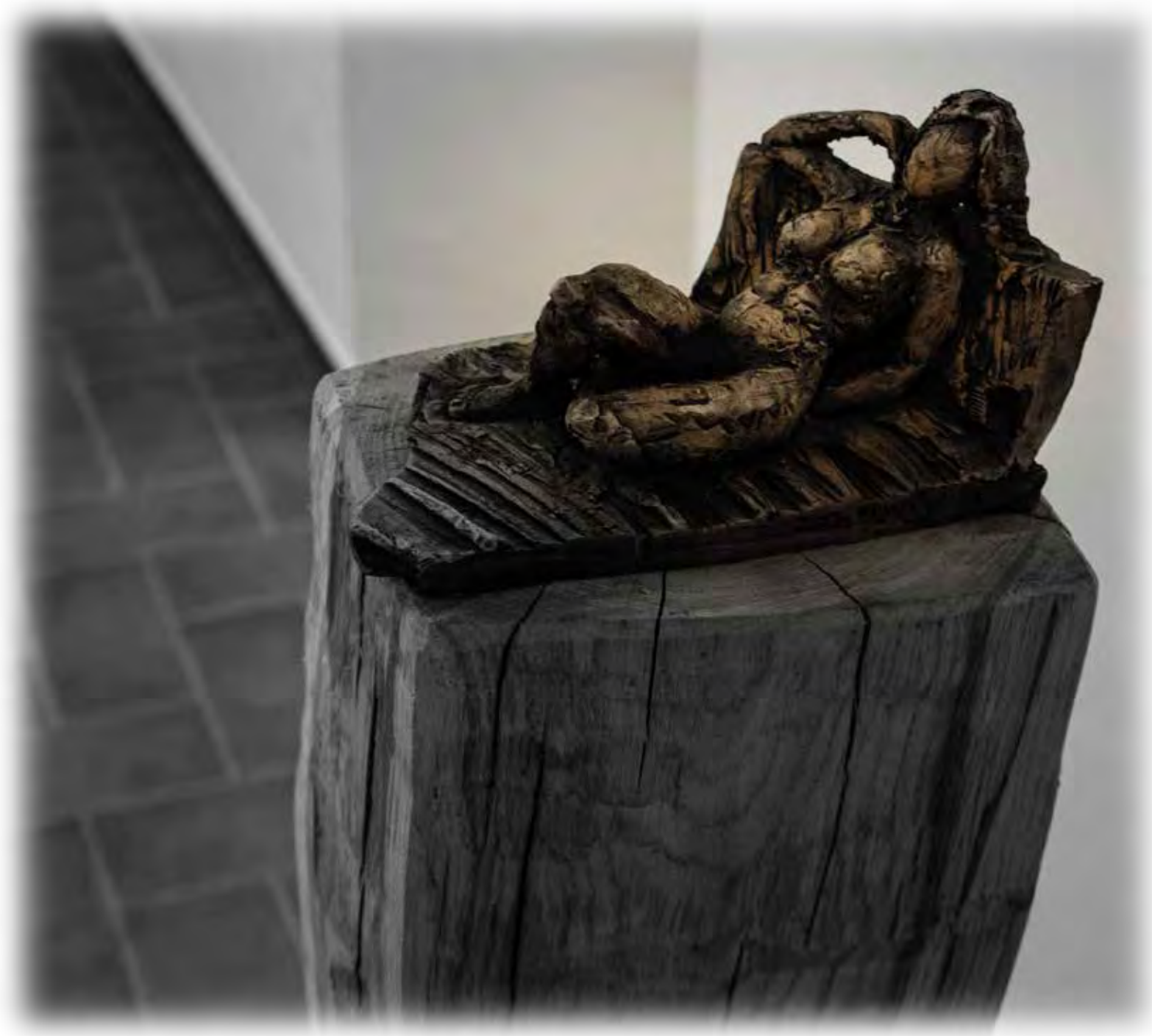
Ležící Matěj Zámečník v roce 2020